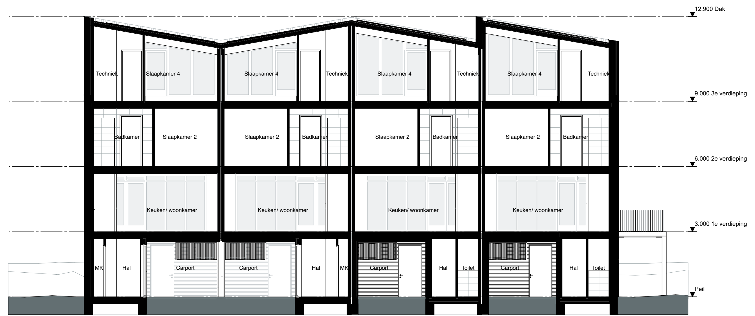
Doorsnede A Schaal 1:100