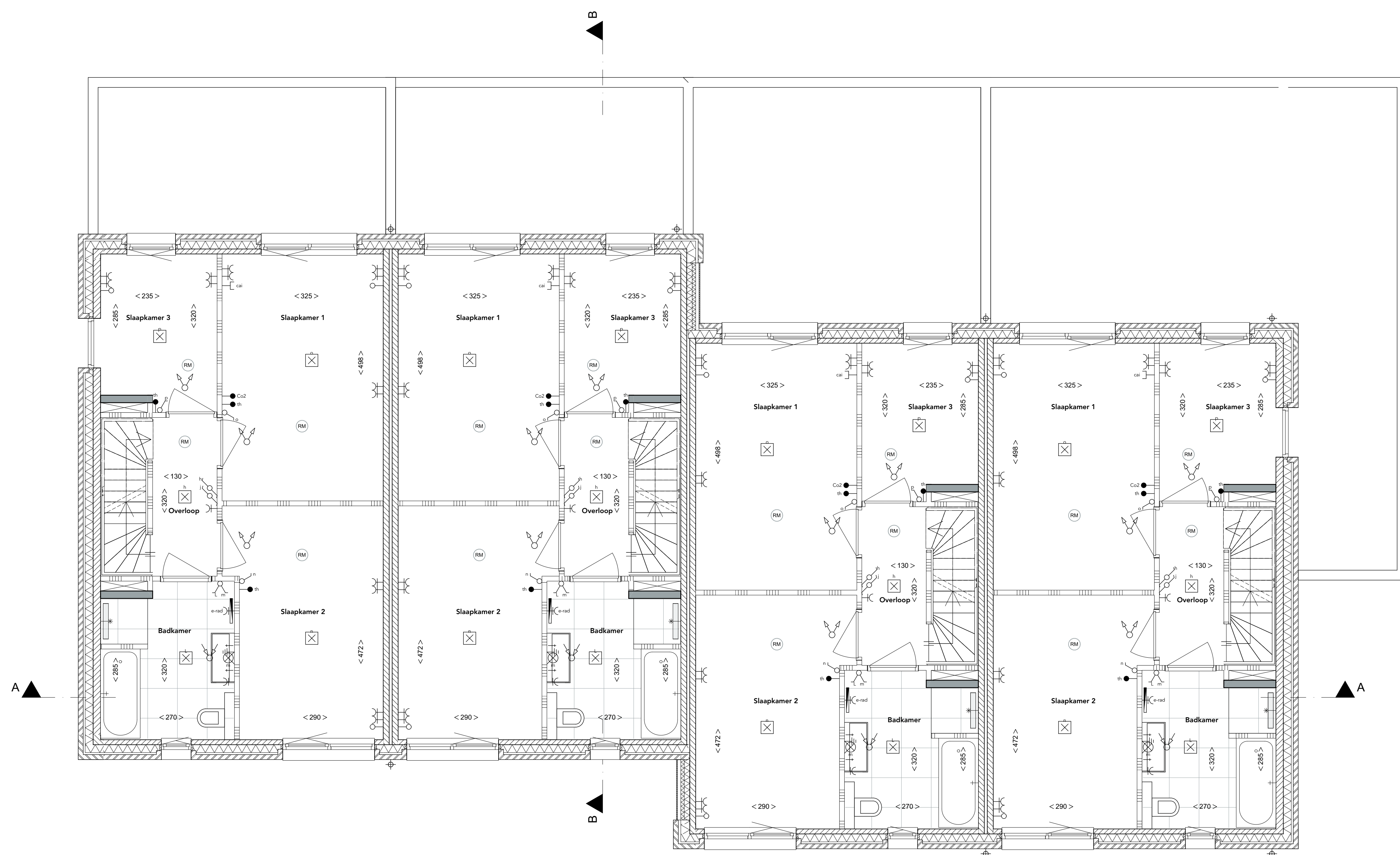
2e verdieping Schaal 1:50