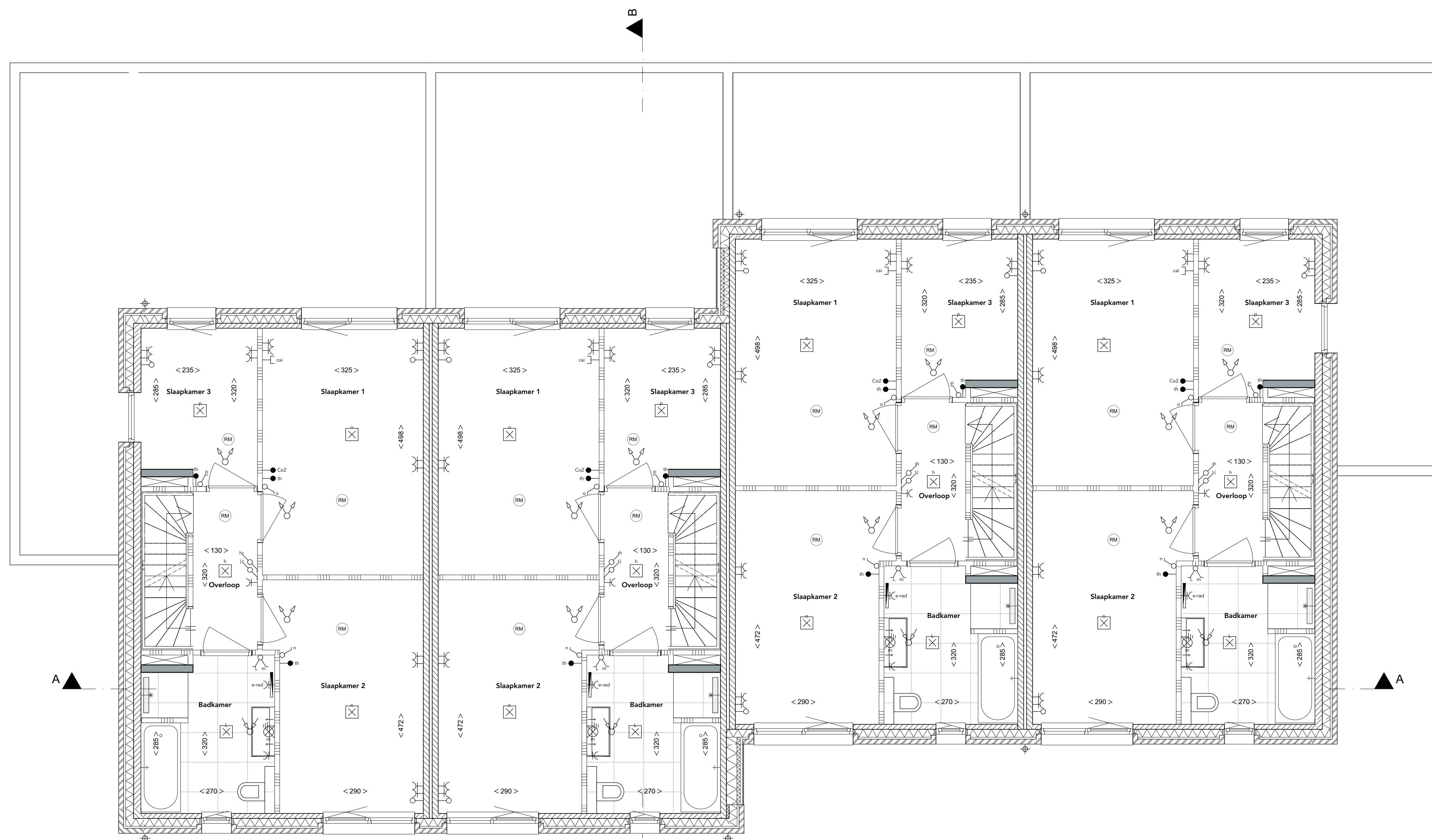
2e verdieping Schaal 1:50