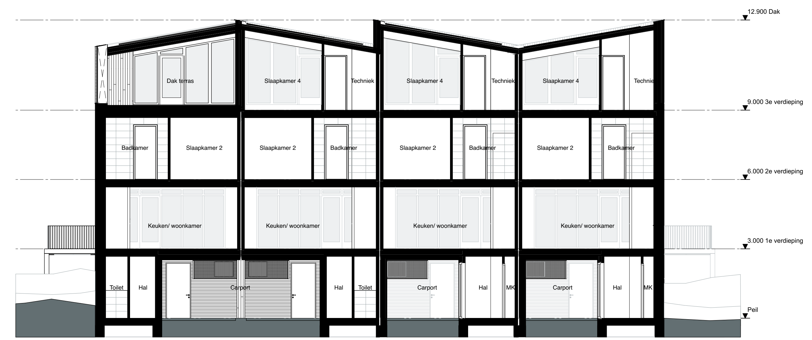
Doorsnede A Schaal 1:100